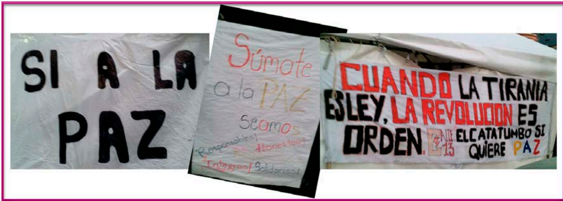
Así se vive dentro del Campamento por la Paz